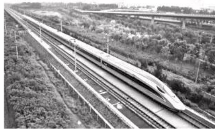
像子弹头的“复兴号”标准动车组

材料二 新中国成立前夕，旧中国只修筑了铁路2.1万多公里；到2017年底，中国铁路里程达到12.7万公里，高铁里程2.5万公里，占世界