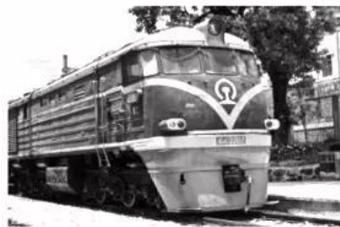
20世纪80年代的“绿皮”内燃机车