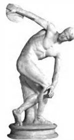
希腊雕塑《掷铁饼者》

材料二 公元前6世纪后期，奥林匹亚广场上挤满了“不朽的年轻人”，这是胜利者的雕像，他们被视为英雄，为艺术家提供了研究人类形体的机会。树立胜利者的雕像是奥林匹克运动会上的一种风气，体育训练和奥林匹克运动会 对希腊雕塑的影响最为深远。